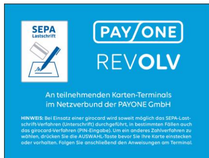
Abb. zeigt exemplarisch Akzeptanzzeichen (Decal) zum Netzwerk der PAYONE.

Teilnehmende Händler informieren im Kassensbereich über ihre Zugehörigkeit zu einem Netzwerk mithilfe eines erweiterten, eindeutigen SEPA-Lastschrift-Akzeptanzzeichens: